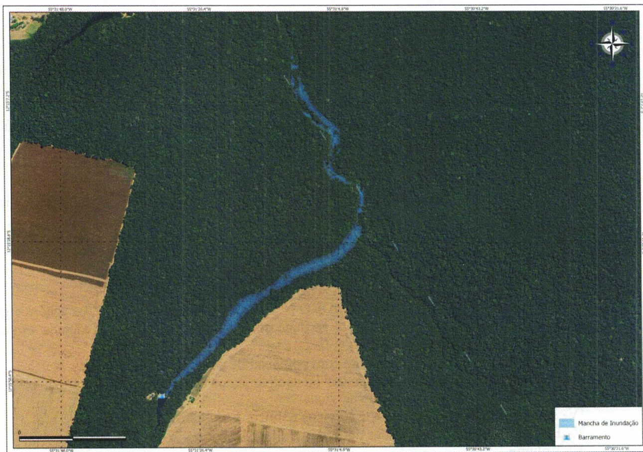
Figura 1. Mancha de inundação

E, concluiu que, a “[...] A mancha de inundação da barragem (Figura 5), dentro do polígono formado, representa uma área de 8,12 ha que possivelmente será inundada em caso de rompimento hipotético da barragem, segundo a metodologia simplificada recomendada pela ANA. O possível rompimento não afetara quaisquer edificações nem estradas vicinais e municipais, sem grande impacto ambiental [..] ” (Fls. 239-240) (grifo nosso), conforme imagem a seguir.